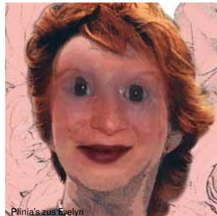
Plinia's zus Evelyn

De spil van Naturalis Hysteria is de fictieve fotografe Plinia Thielemans. Haar identiteit en haar vriendenkring ontwikkelen zich op basis van gebeurtenissen in de werkelijke wereld. Waar het echter in de media meestal gaat over de actualiteit speelt Plinia's leven zich twee jaar geleden af. We hebben er bewust voor gekozen, omdat de vloeibare wereld in twee jaar tijd voldoende gestold